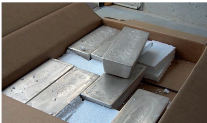
Llegada de nuevos lingotes de plata al depósito (peso por lingote aprox. 31 kg).

La Cooperativa almacena sus lingotes de forma independiente de bancos en dos depósitos diferentes y separados situados en Suiza. Los metales plata, platino y paladio se almacenan en un depósito situado en zona franca, los lingotes de oro en un depósito situado en el interior del país. El acceso a los depósitos es únicamente posible contando con la presencia simultánea de varios representantes independientes de la Cooperativa. Una vez al año, como mínimo, se realiza un inventario de todas las existencias, conjuntamente con nuestro comité de auditoría. En el área de socios de nuestra página principal se encuentran las listas de lingotes con los números de lingote y los datos específicos de peso.